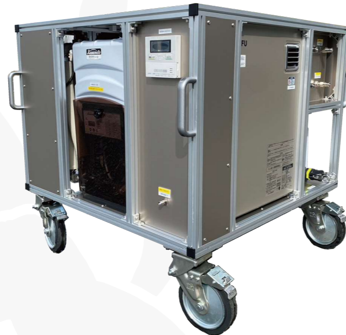
【シャワー浄水ユニット本体写真】

④ 【排水利用浄水セット（※オプション）】にてトイレ（水栓）配管接続（※配管分岐工事が必要）も可能